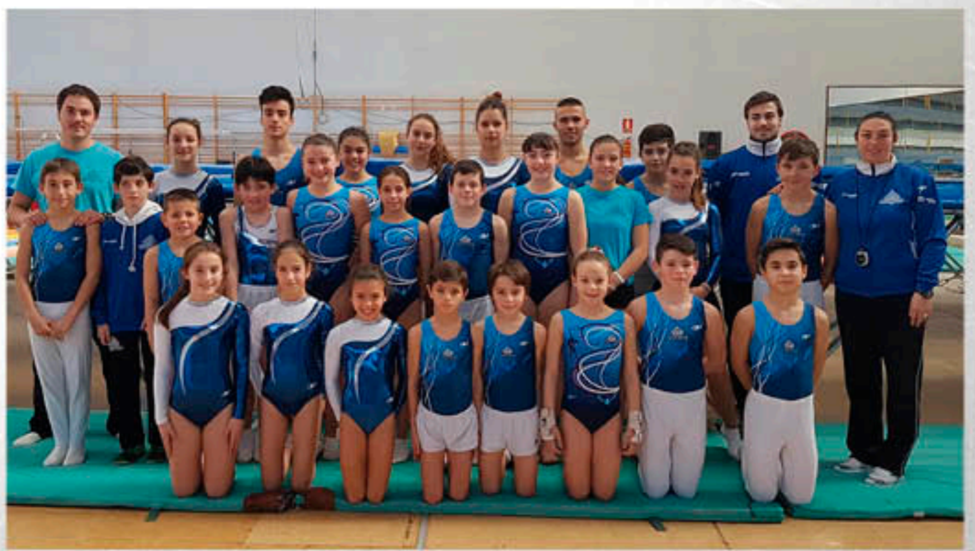
Gimnastas y entrenadores de TRA

GRAN EQUIPO, A SEGUIR TRABAJANDO Y A DISFRUTAR DE UN AÑO 2017 REPLETO DE ÉXITOS