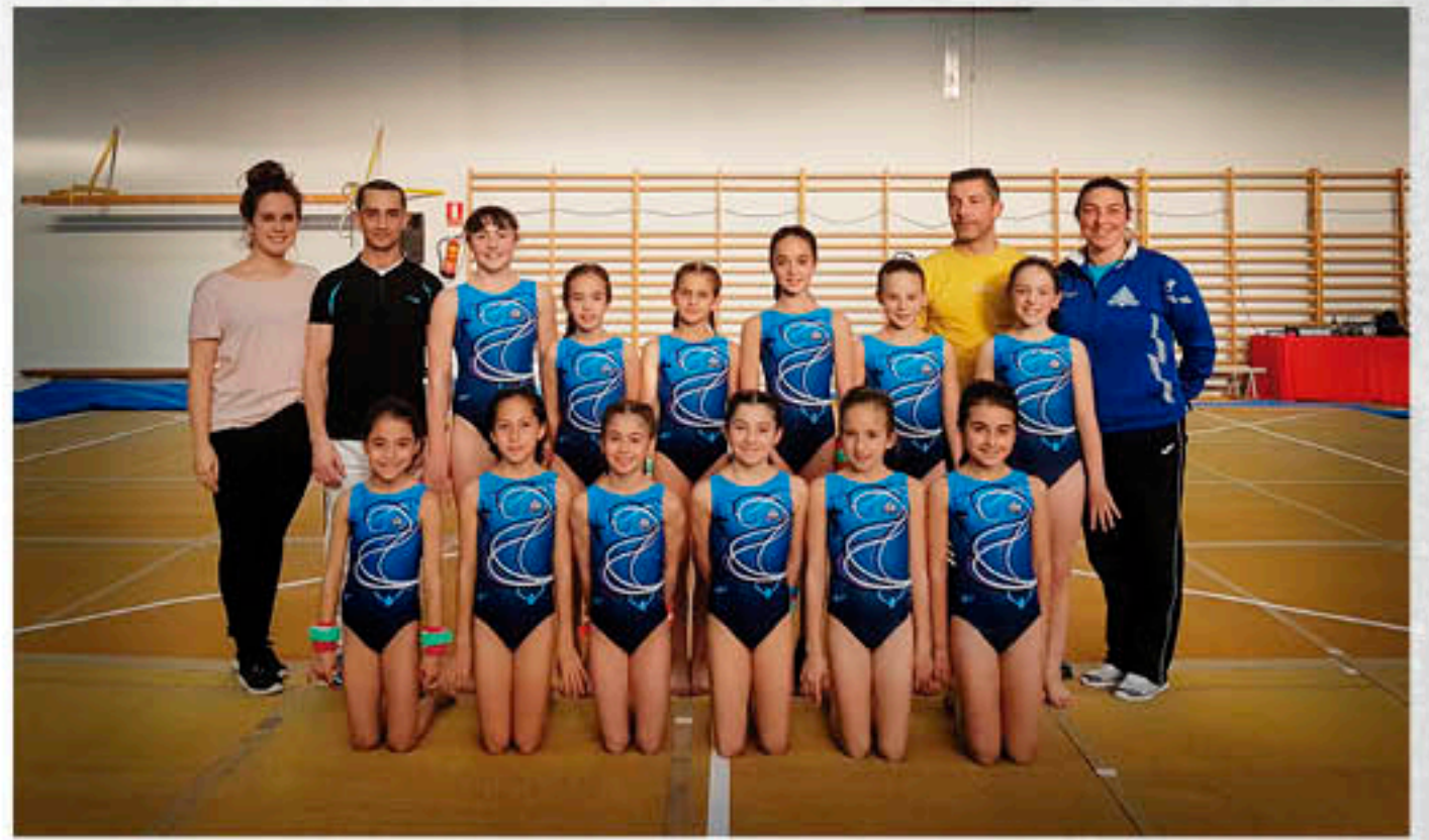
Gimnastas y equipo técnico de GAF

GRAN EQUIPO, A SEGUIR TRABAJANDO Y A DISFRUTAR DE UN AÑO 2017 REPLETO DE ÉXITOS